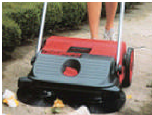
TopSweep 55 (255)