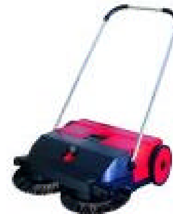
& TopSweep 75 (275)

2 flat circular brooms with inverse rotation and direct-drive (without belt).