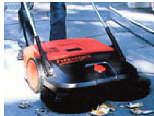
& Turbo 970 (496)