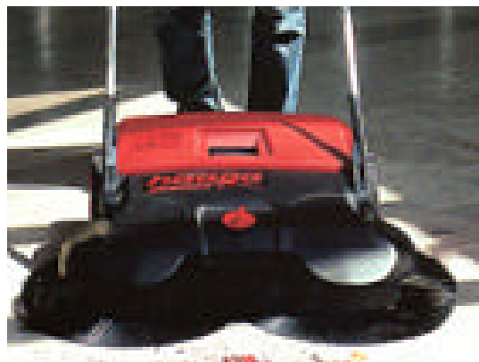
Turbo 770 (476)