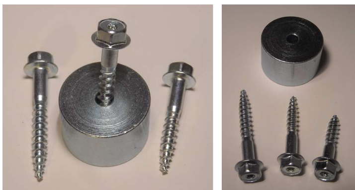
Adaptateur universel (pour sculpter etc., article-no 936000)

c'est une bague ouvert, en acier 5mm, avec un Ø-extérieur de 43mm et 26 mm de large, par exemple pour fixer des perceuses avec le standard américaine de 38mm (1,5") au lieu de la norme UE de 43mm