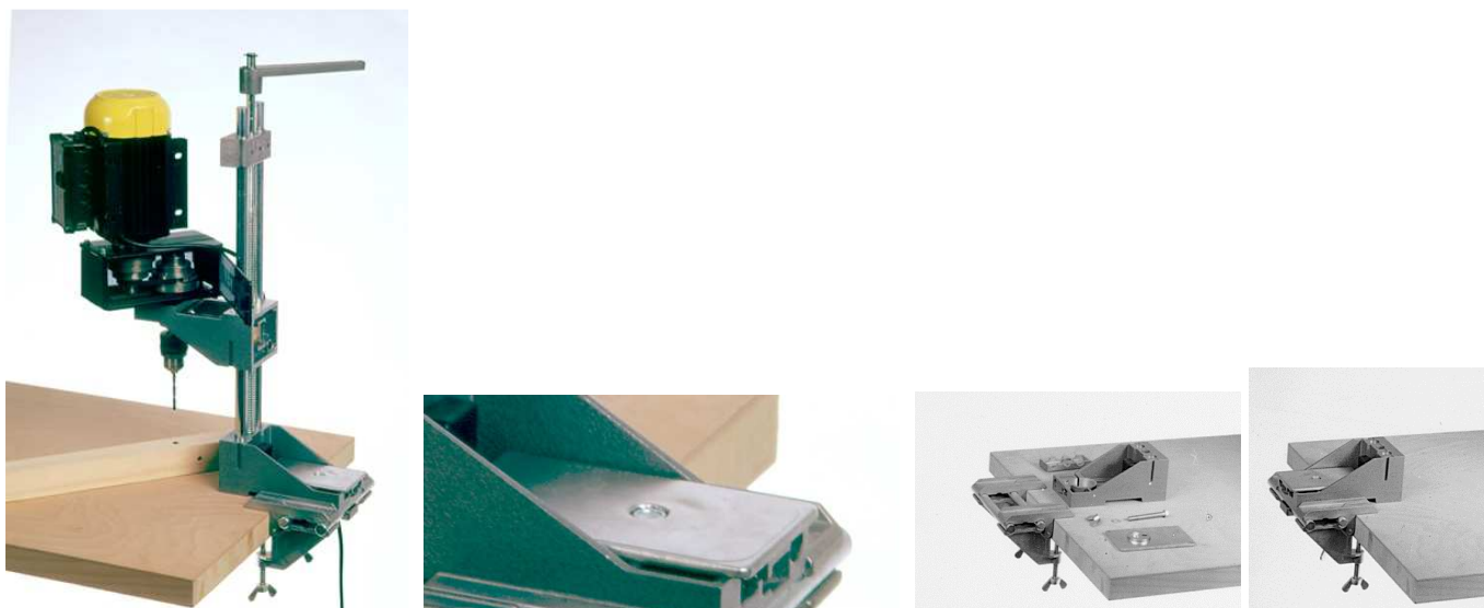
L'usage et des détails de la Plaque de perçage (article-no 935000)

sans image : Adaptateur 38/43mm (article-no 936060)